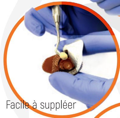
Facile à compléter