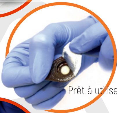
Prêt à utiliser