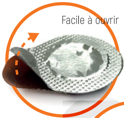
Facile à ouvrir