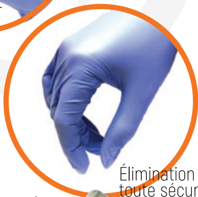
Élimination en toute sécurité

Élimine complètement le risque d'infections croisées